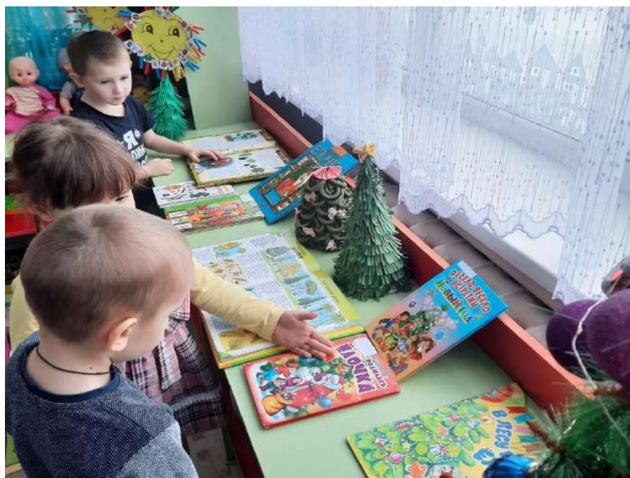
Библиотека «Ёлочка – красавица»