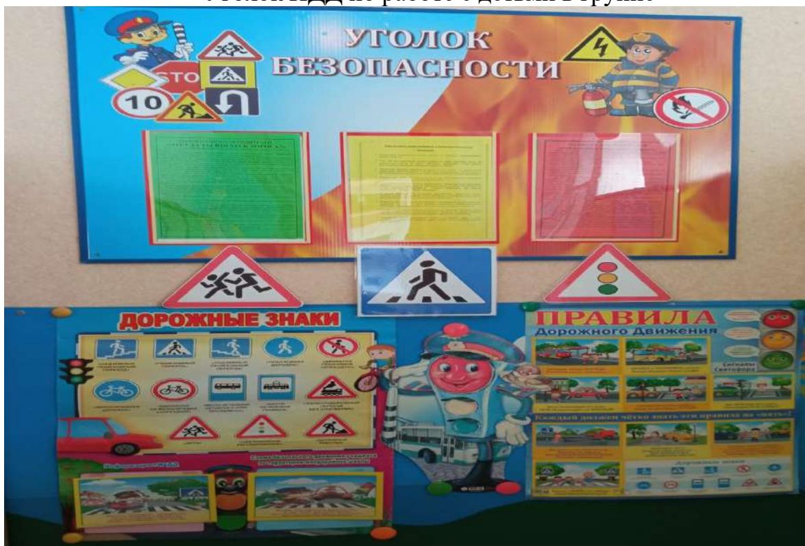
Уголок для родителей по ПДД в группе