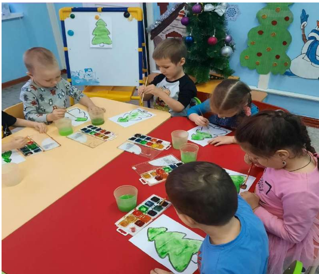
Рисование «Наша ёлочка»