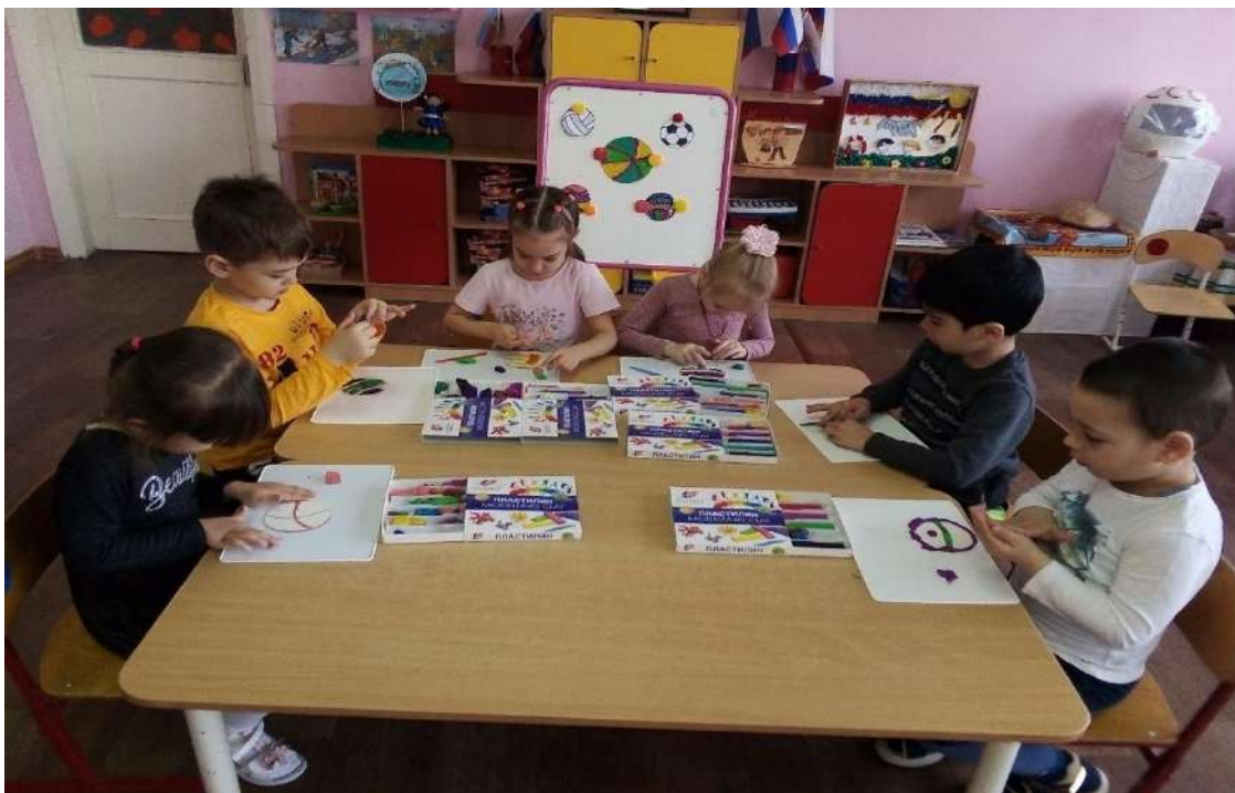
Аппликация «Дерево Здоровья»