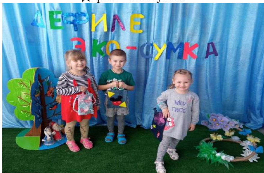
Дефиле - «Экосумка»