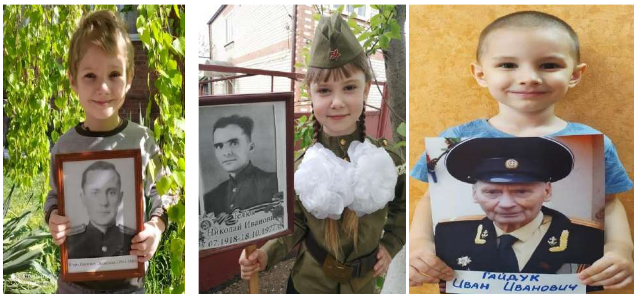
Патриотический уголок в группе