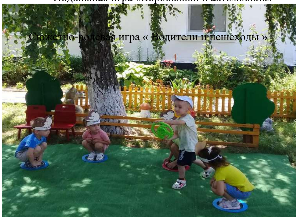
Сюжетно-ролевая игра « Водители и пешеходы »