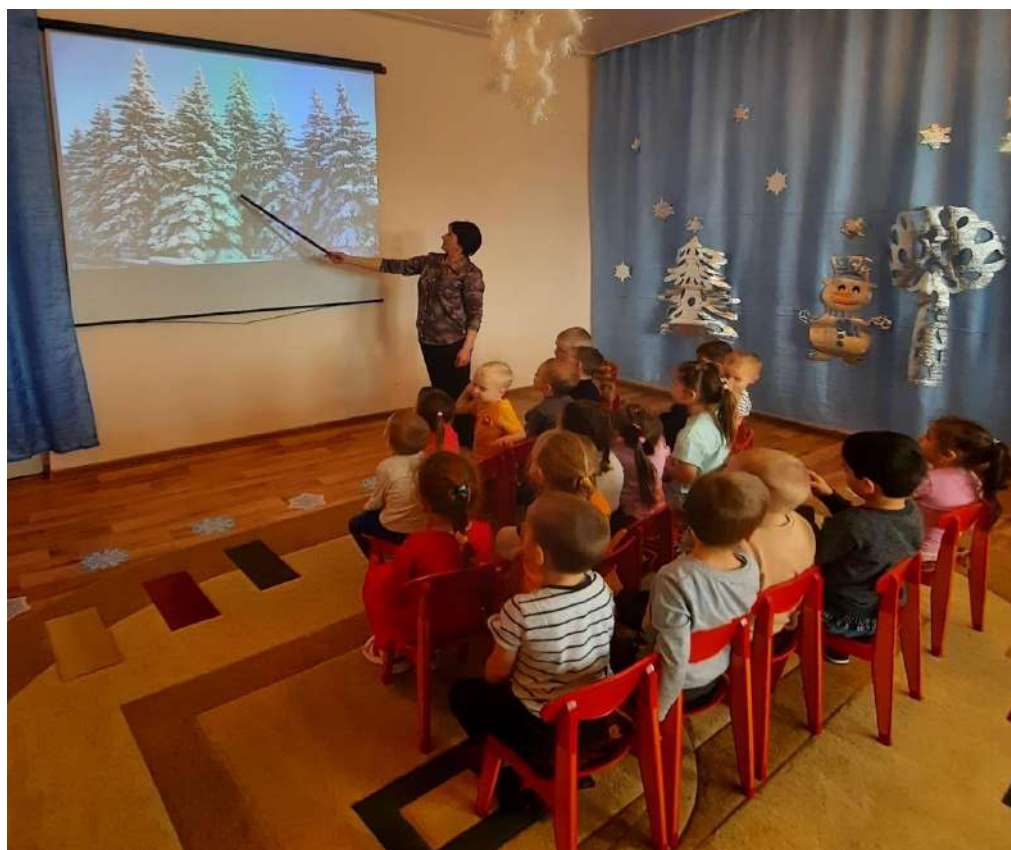
Просмотр презентации «Ёлочка красавица» «С кем дружит ель»