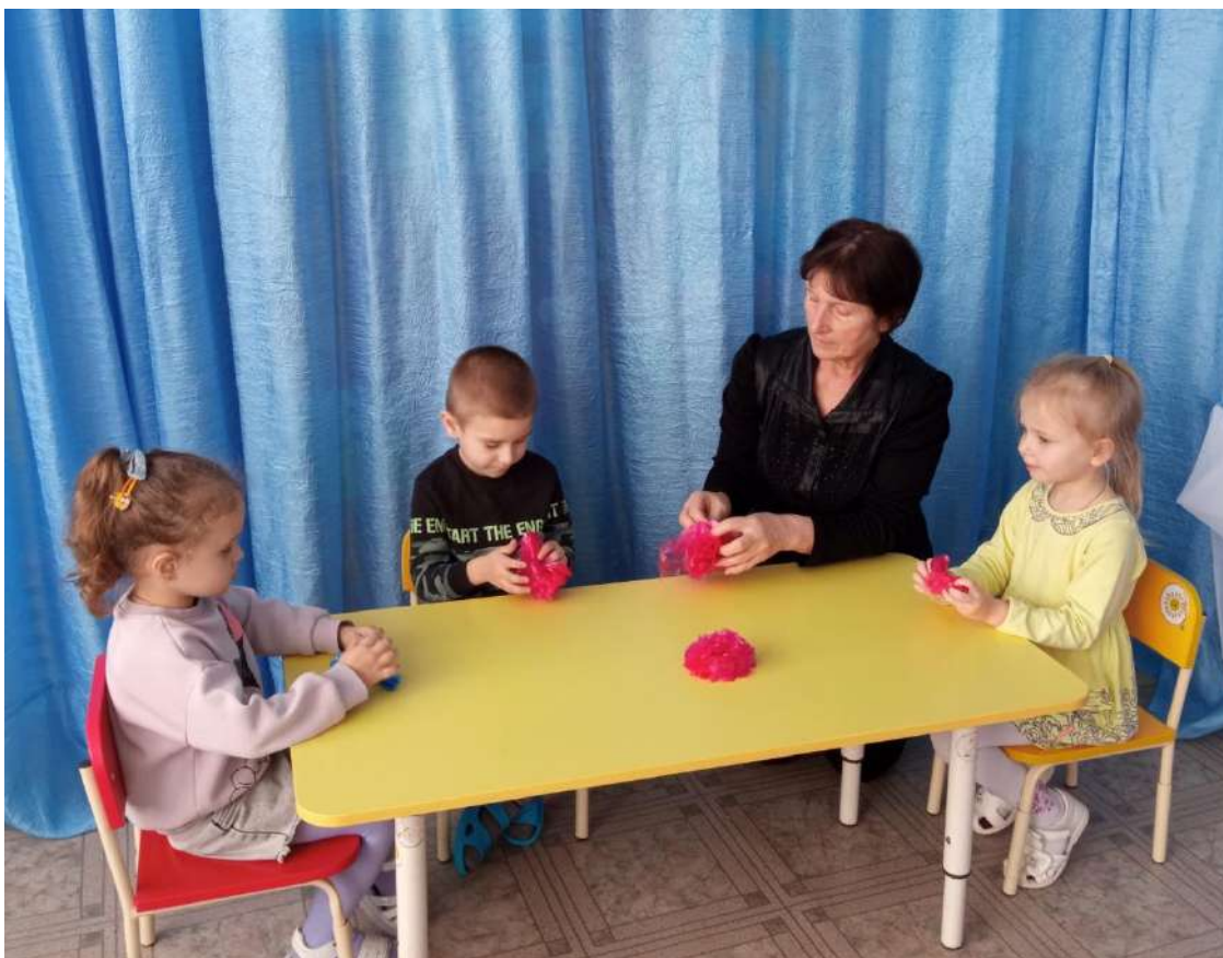
Цветы из полиэтиленовых пакетов