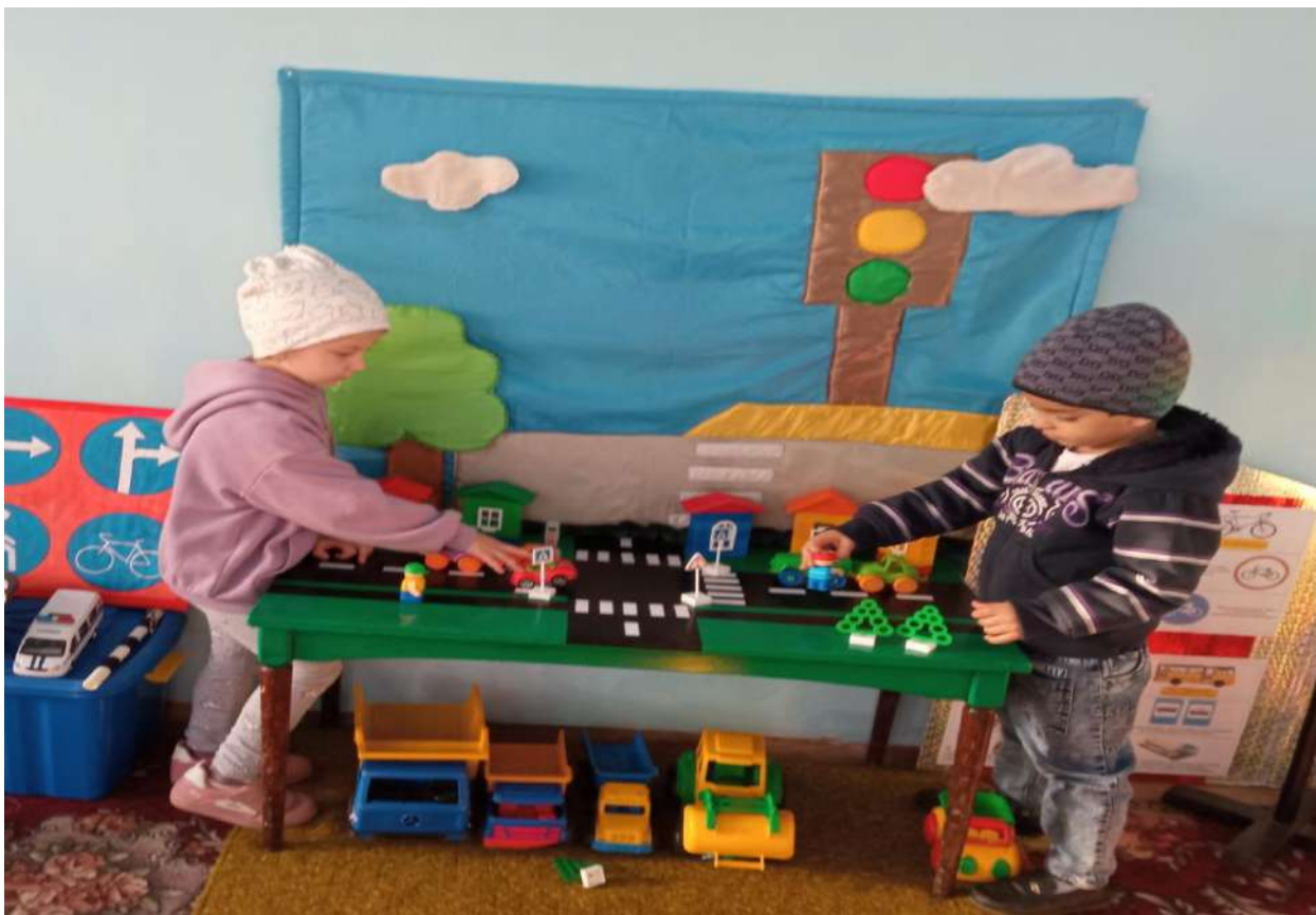
Подвижная игра «Воробушки и автомобиль»