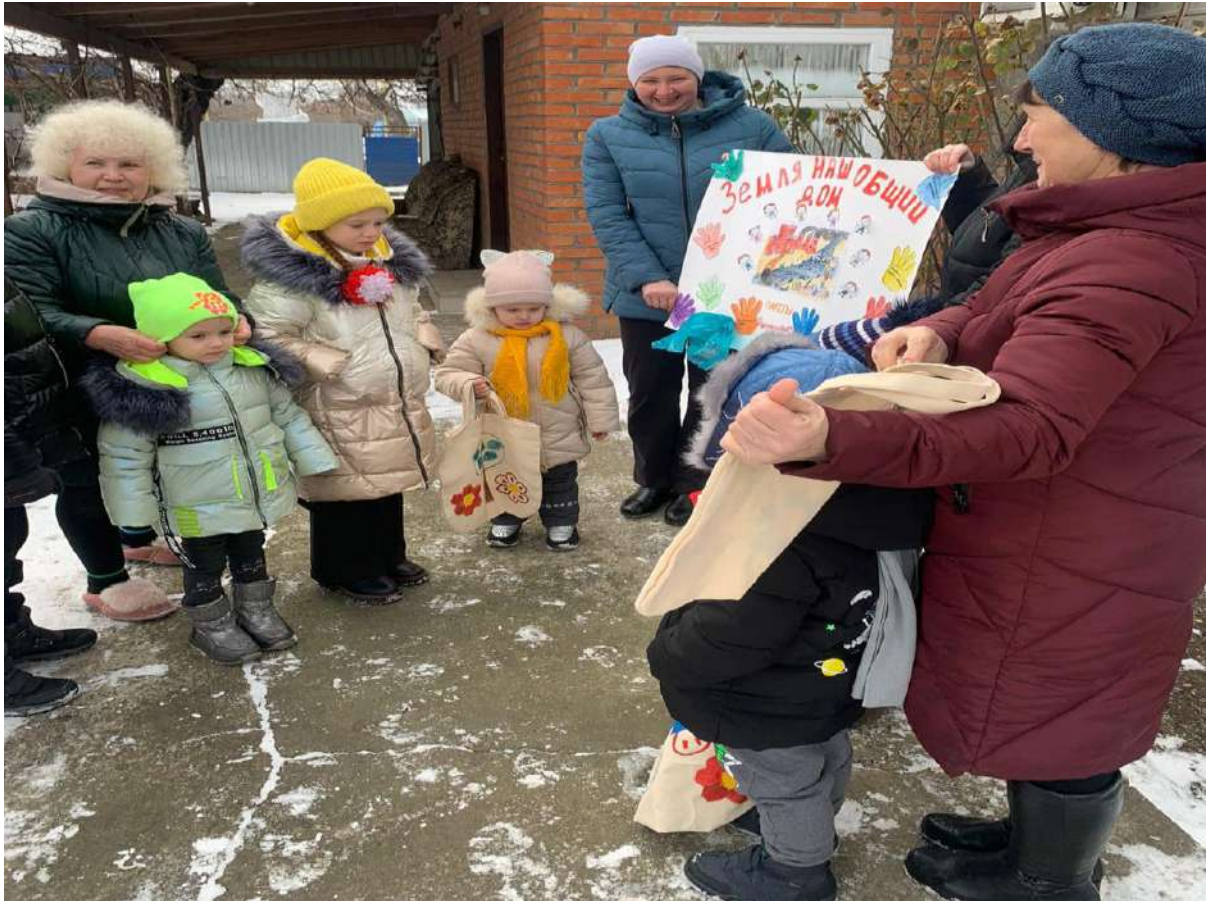
Посещение многодетной семьи на дому