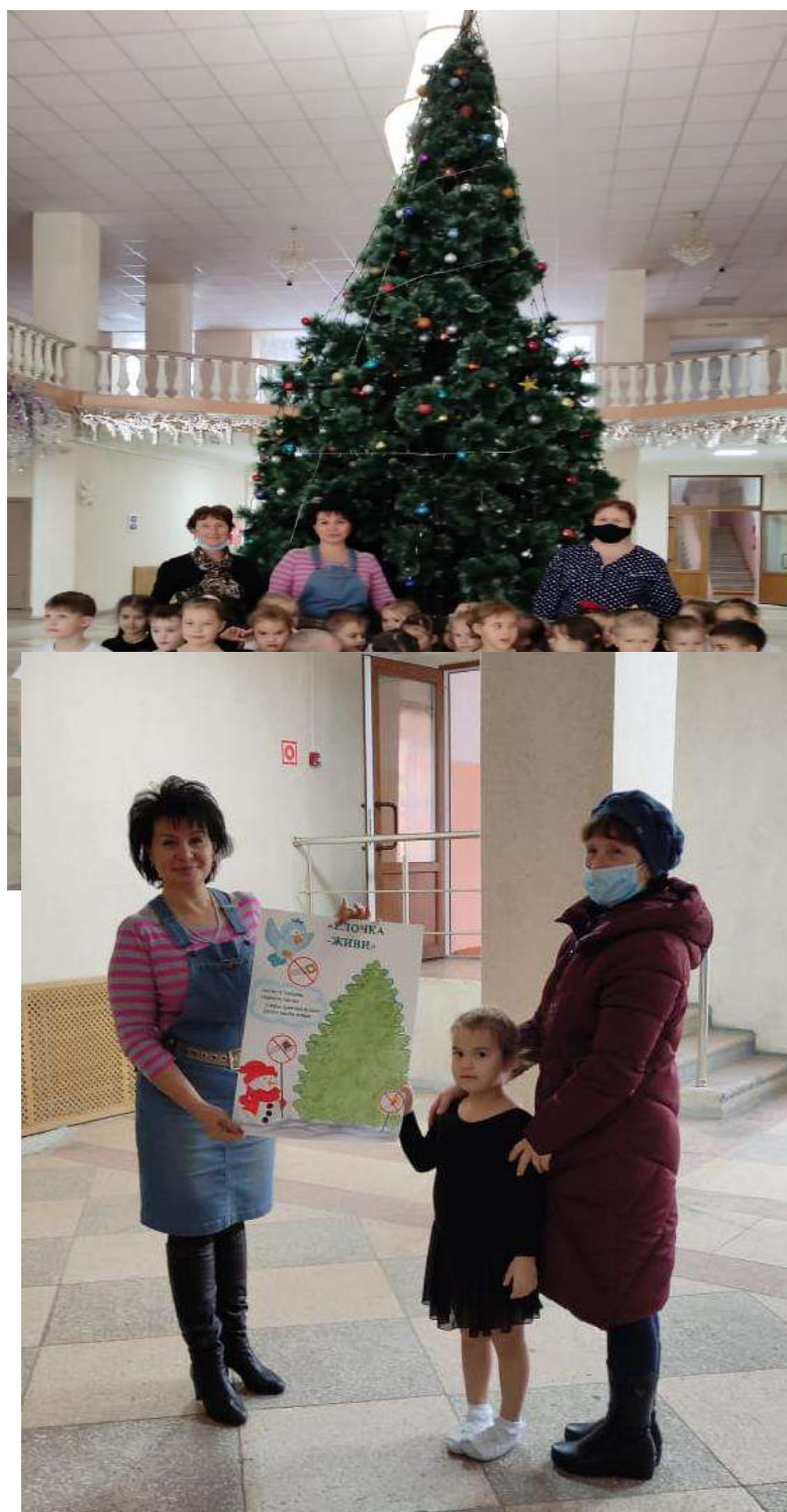
Посещение социального партнера дом культуры станицы Старовеличковской