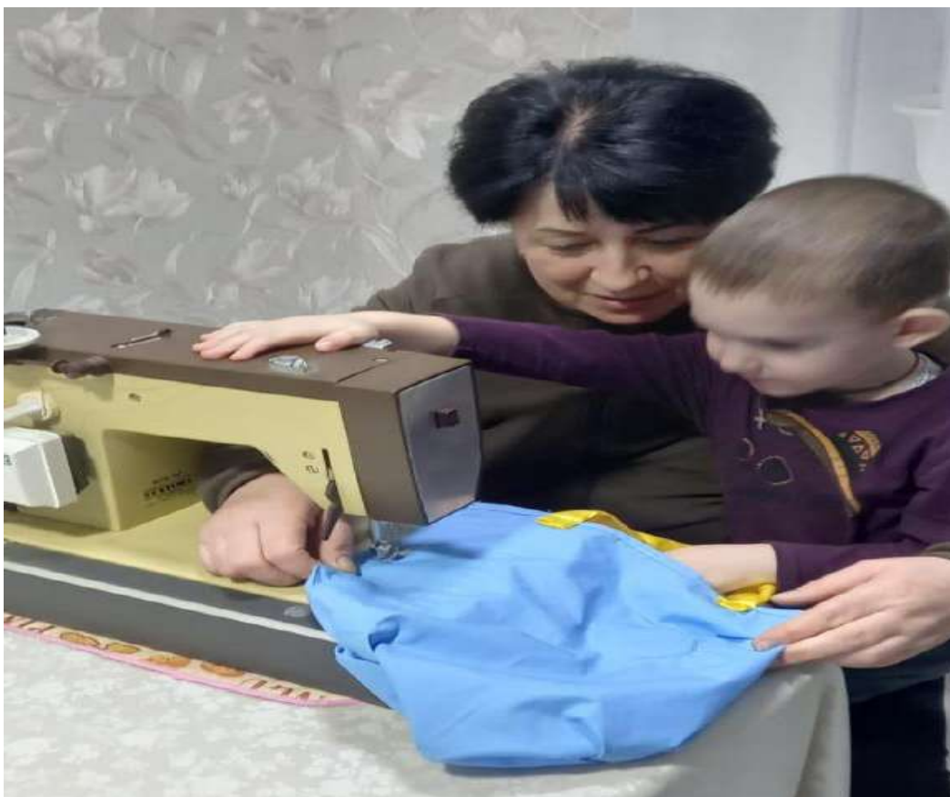
Пошив экосумок дома