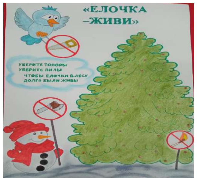
Выставка плакатов «Ёлочка живи!»