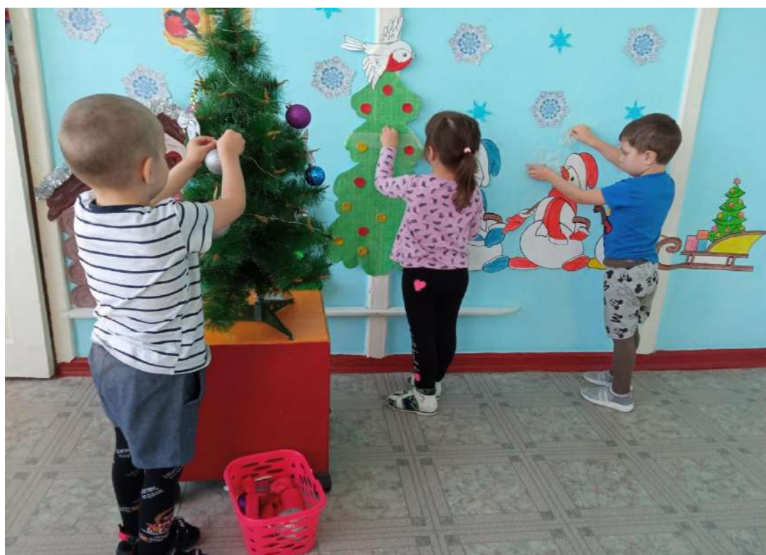
Украшение елки в группе