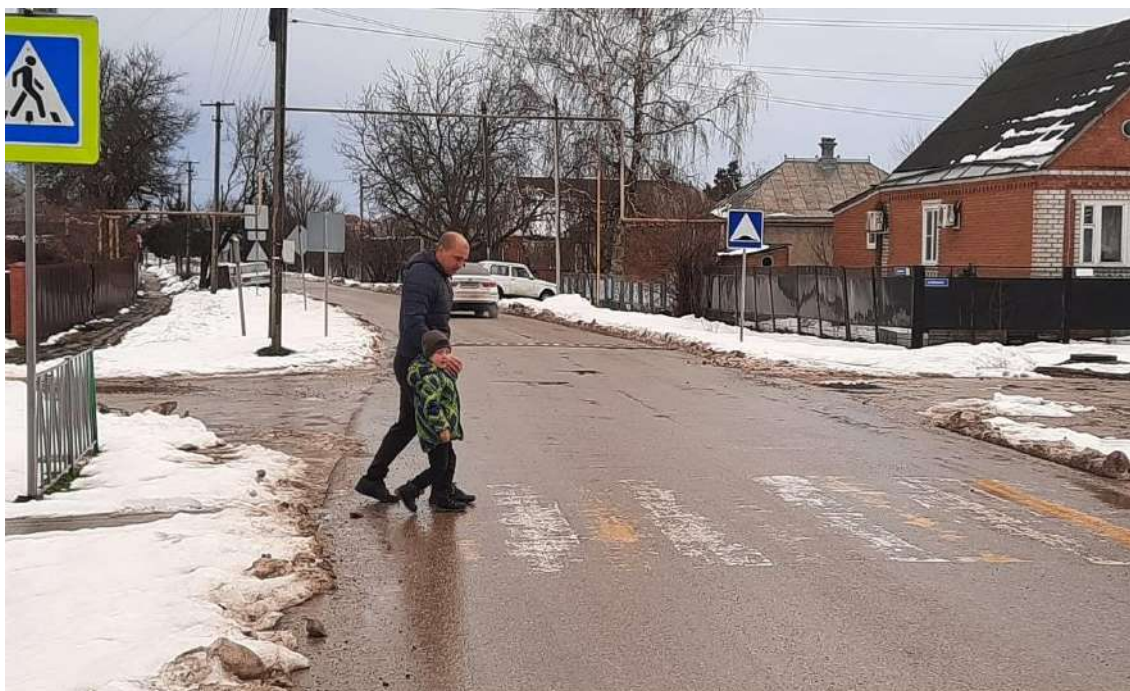
Работа родителей по изучению правил дорожного движения