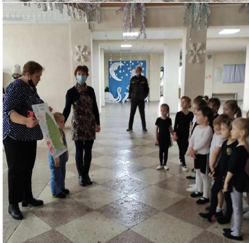
Участие в акции «Ёлочка живи»