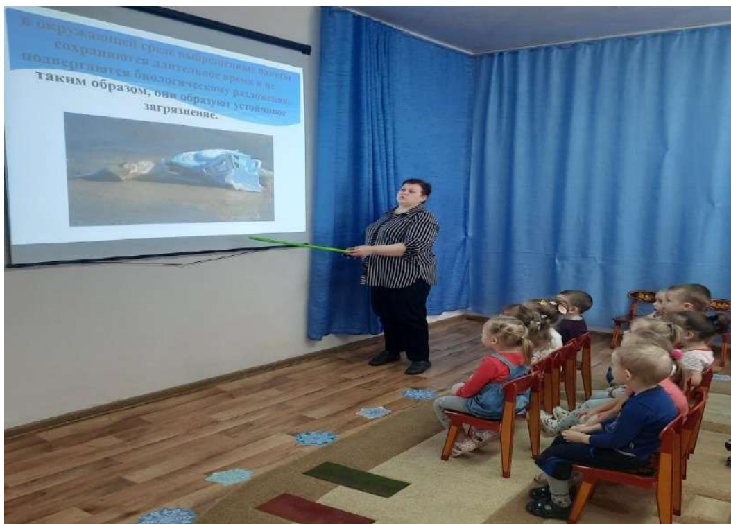
Беседы с детьми о вреде пластика