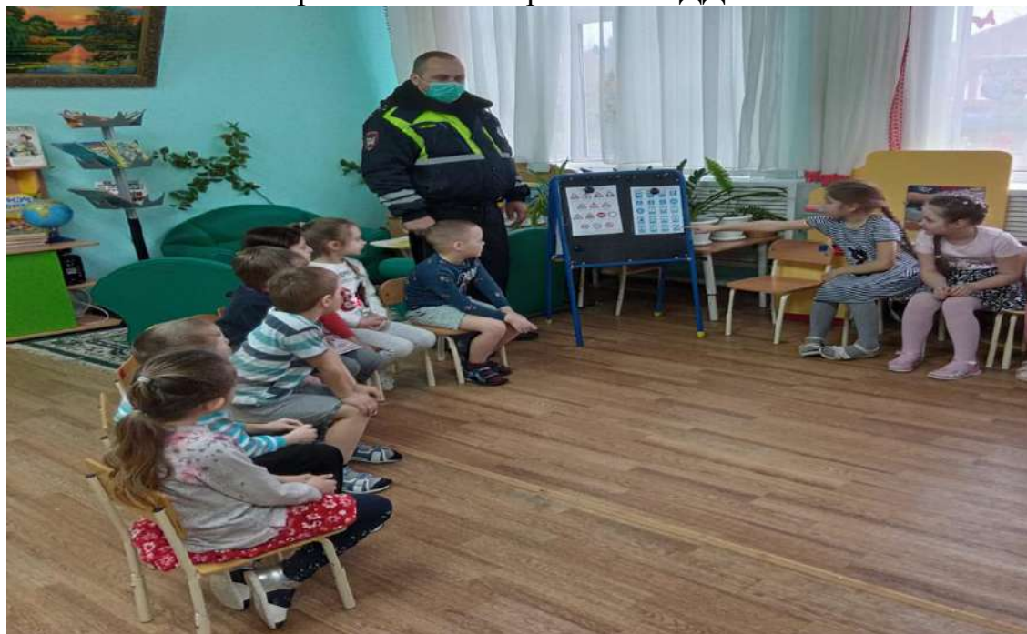
Библиотека в группе