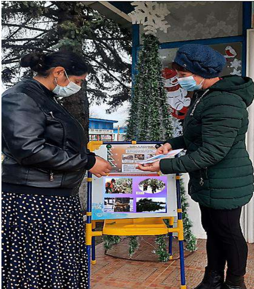
Работа с родителями анкетирование, консультации