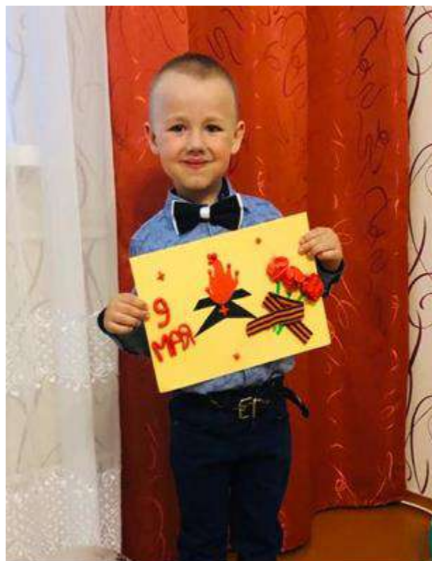
Аппликация в старшей группе «Георгиевская лента»