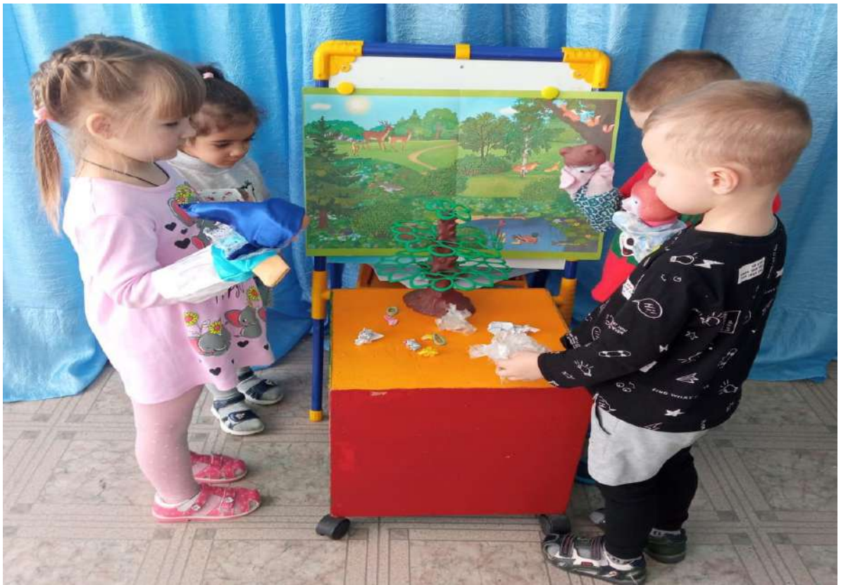
Театрализация экологических сказок