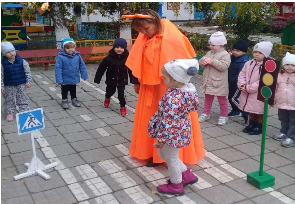
Развлечение «Как лисичку учили правилам дорожного движения»