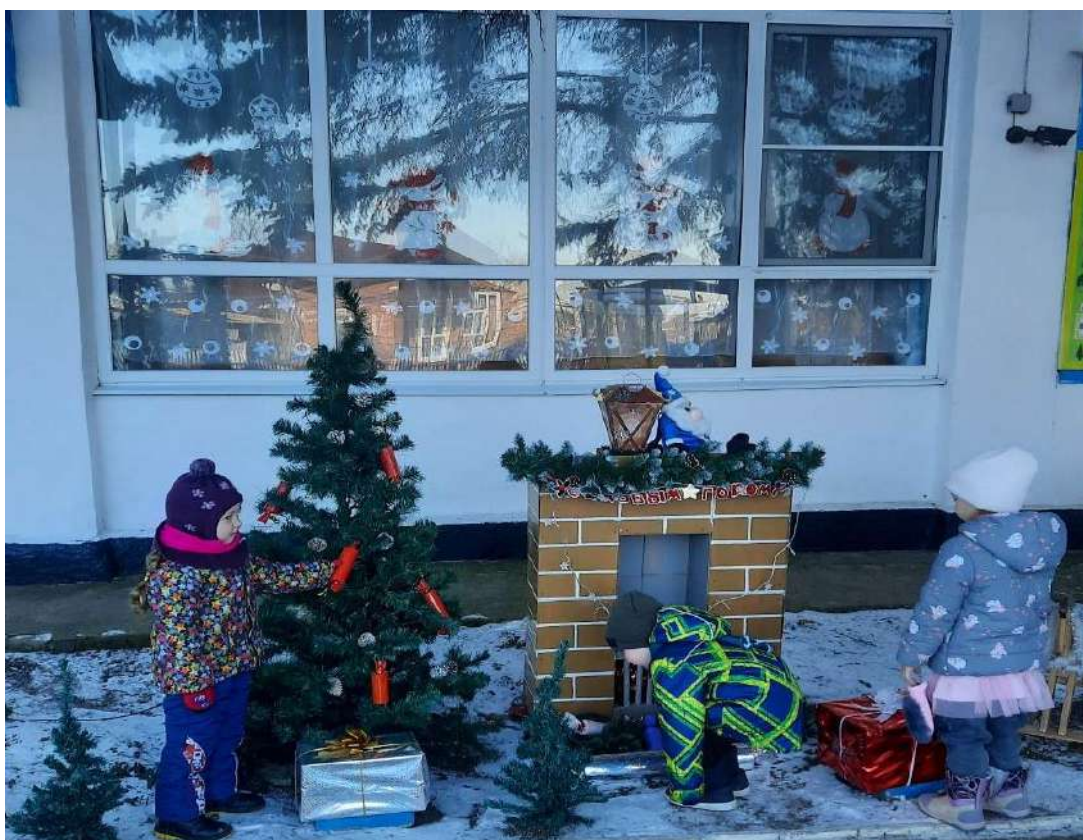
Украшение ёлочки на участке детского сада