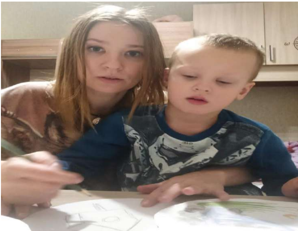
Изготовление знаков: «Что нельзя делать в природе».