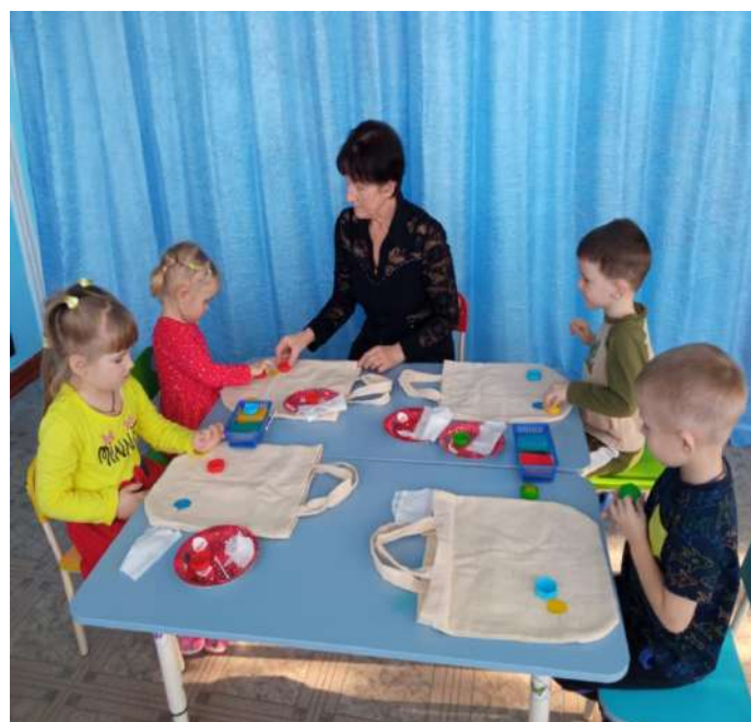
Украшение экосумок в группе