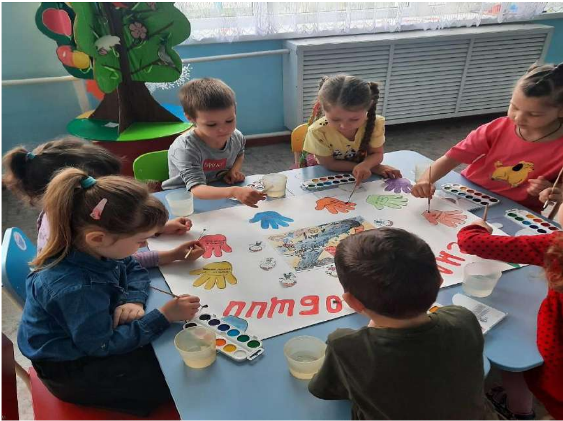
Стенгазета «Земля наш общий дом»