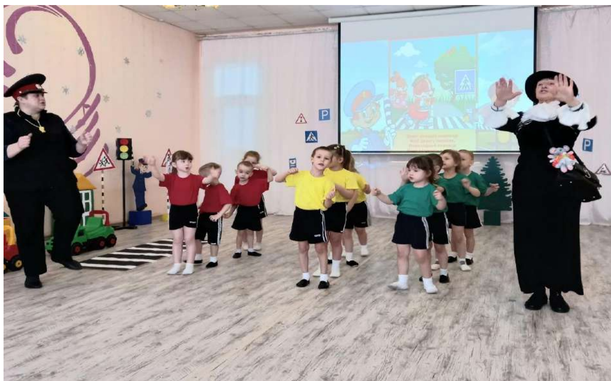
Спортивный досуг «Азбука пешехода для Шапокляк»