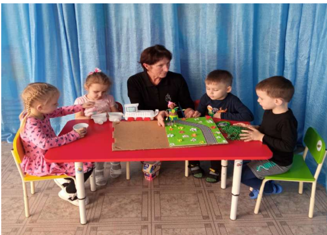
Поделка «Эколята – лучшие друзья природы»